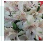
TIPUS B: 20 €/setmana