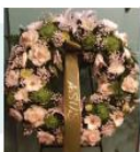
CORONA M: 198 €