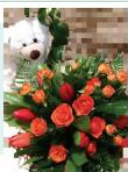
OBSEQUI C: 100 €