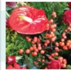
TIPUS A: 35 €/setmana