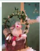
OBSEQUI A: 100 €